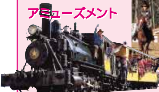
夢を乗せて走るアメリカ開拓史 SLワイパウ号&バージニア号