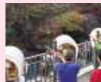
ハitek射的レーザーガン