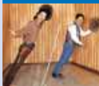
ミステリーショック