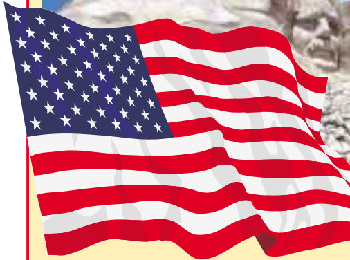
アメリカンドーム マウントラッシュモアとアメリカンピクテリア 様式の建造物に被われた巨大空間

George Washington ジョージ・ワシントン Thomas Jefferson トーマス・ジェファソン Theodore Roosevelt セオドア・ルーズベルト Abraham Lincoln アブラハム・リンカーン