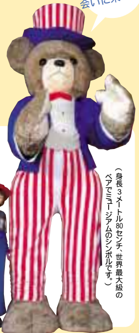
(身長3メートル80センチ、世界最大級の ベアミュージアムのシンボルです。)