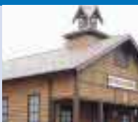
ピックリスクール