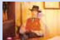
保安官事務所「クリント・イースウッド」