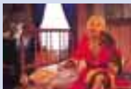
ホテル「マリリン・モンロー」