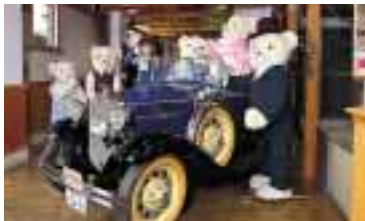
クラシックカーでお出かけのフーパー家

テディベアはウェスタン村のシンボル、マウントラッシュモアにあるルーズベルト大統領の逸話より生まれた「ぬいぐるみ」で世界中の人に愛されています。ここアメリカンドームの中では、日本で初めての等身大のベアがアンティークなインテリアに囲まれて楽しそうに暮らしています。