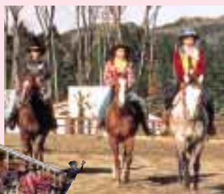
お子様でも気軽に楽しめる 引き馬での乗馬