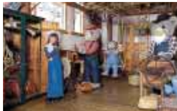
カーター家の工房