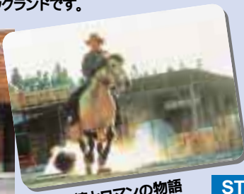
厚い友情とロマンの物語 ワイルドウェスタンショー